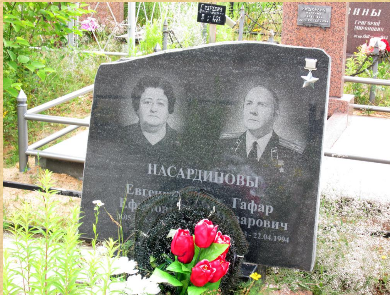
Надгробный памятник, установленный на Северном кладбище (участок 136) в городе Минск.