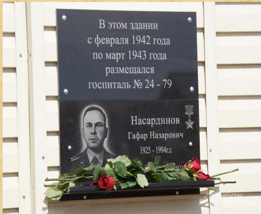
Памятная доска установлена на здании госпиталя, в котором проходил лечение после ранения Г.Н. Насардинов