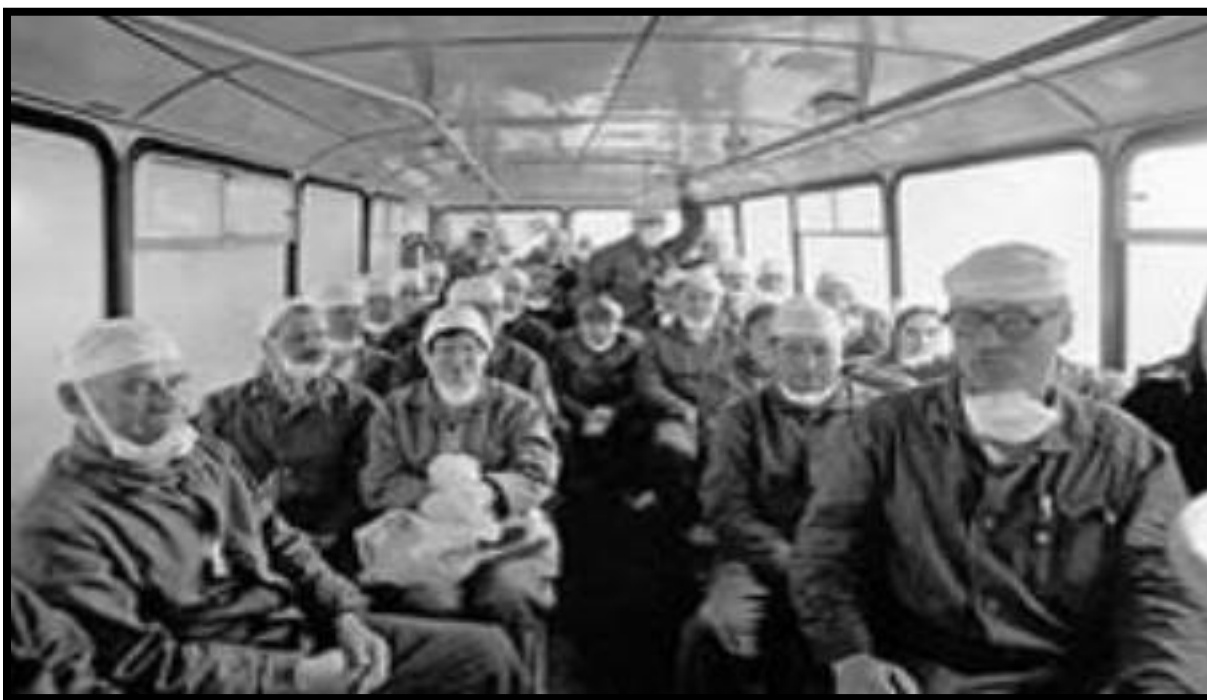
(1986 год. Ликвидаторы последствий аварии Чернобыльской АЭС)

В то время, как многие иностранные средства массовой информации говорили об угрозе для жизни людей, а на экранах телевизоров демонстрировалась карта воздушных потоков в Центральной и Восточной Европе, в Киеве и других городах Украины и Белоруссии проводились праздничные демонстрации и гуляния, посвящённые Празднику весны и труда. Лица, ответственные за сохранение информации в секрете, объясняли впоследствии своё решение необходимостью предотвратить панику среди населения.