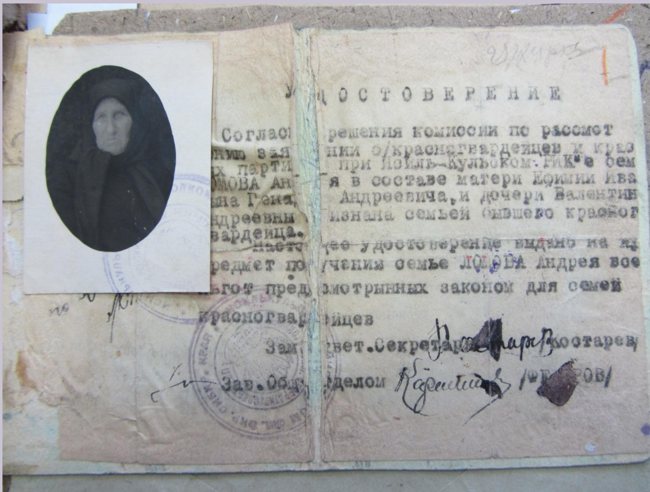
Удостоверение о признании семьи семьей бывшего красногвардейца на предмет получения ЛЬГОТ