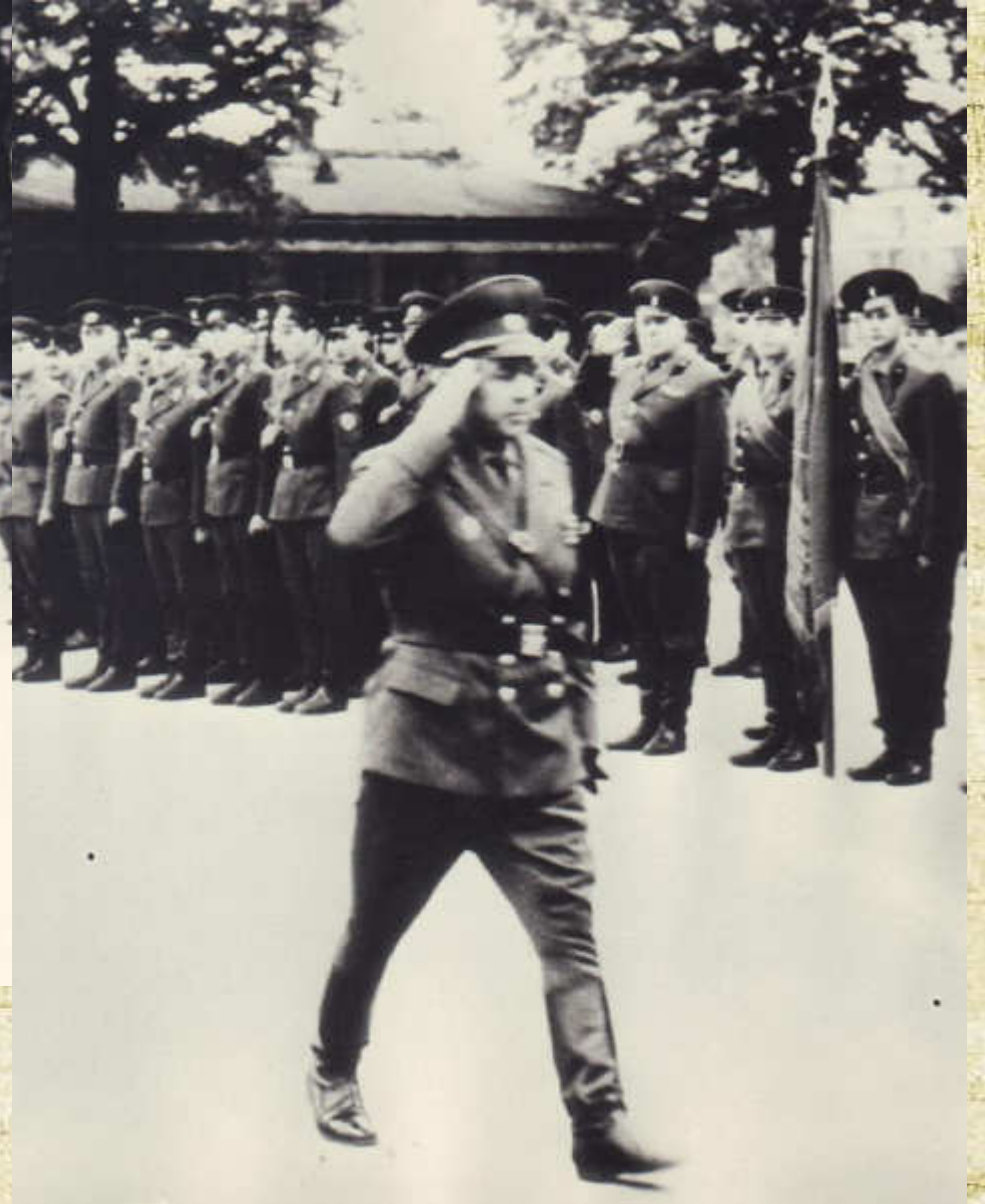
На строевом смотре полка, [1970]