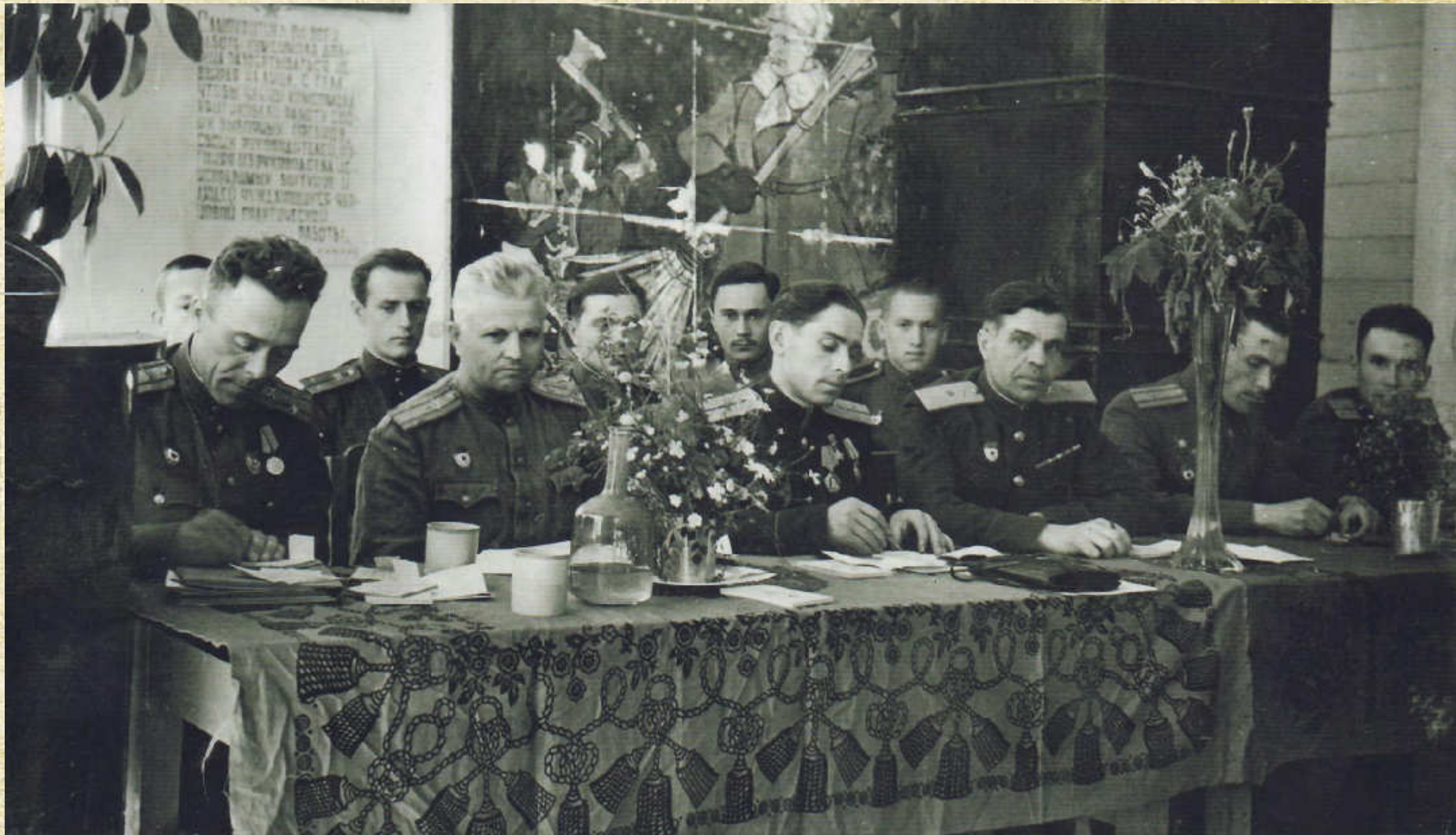
В президиуме 2-го Гвардейского минометно-артиллерийского училища, 1946 год, г. Омск