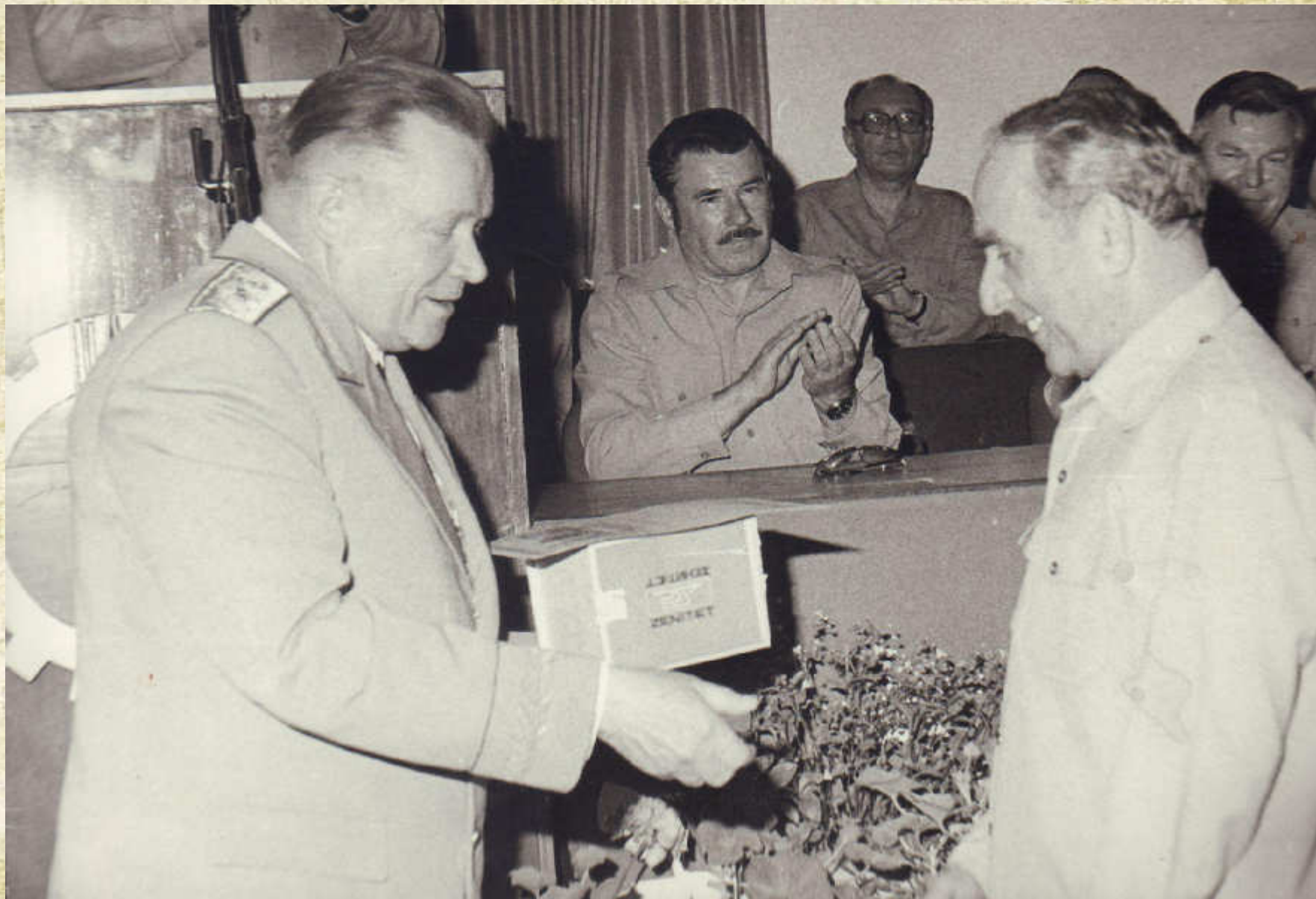
Генерал армии Г. Салманов вручает генерал-лейтенанту И. Кибалю награду. Афганистан, 1985 год