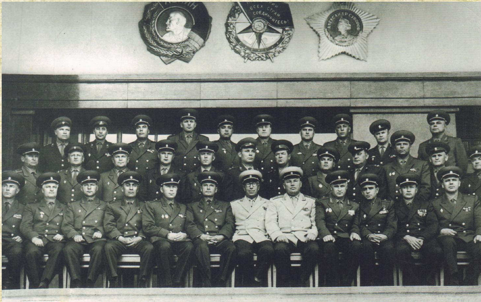
Высшие академические курсы при военной академии им. М.В. Фрунзе первый выпуск 1968 г. г. Москва