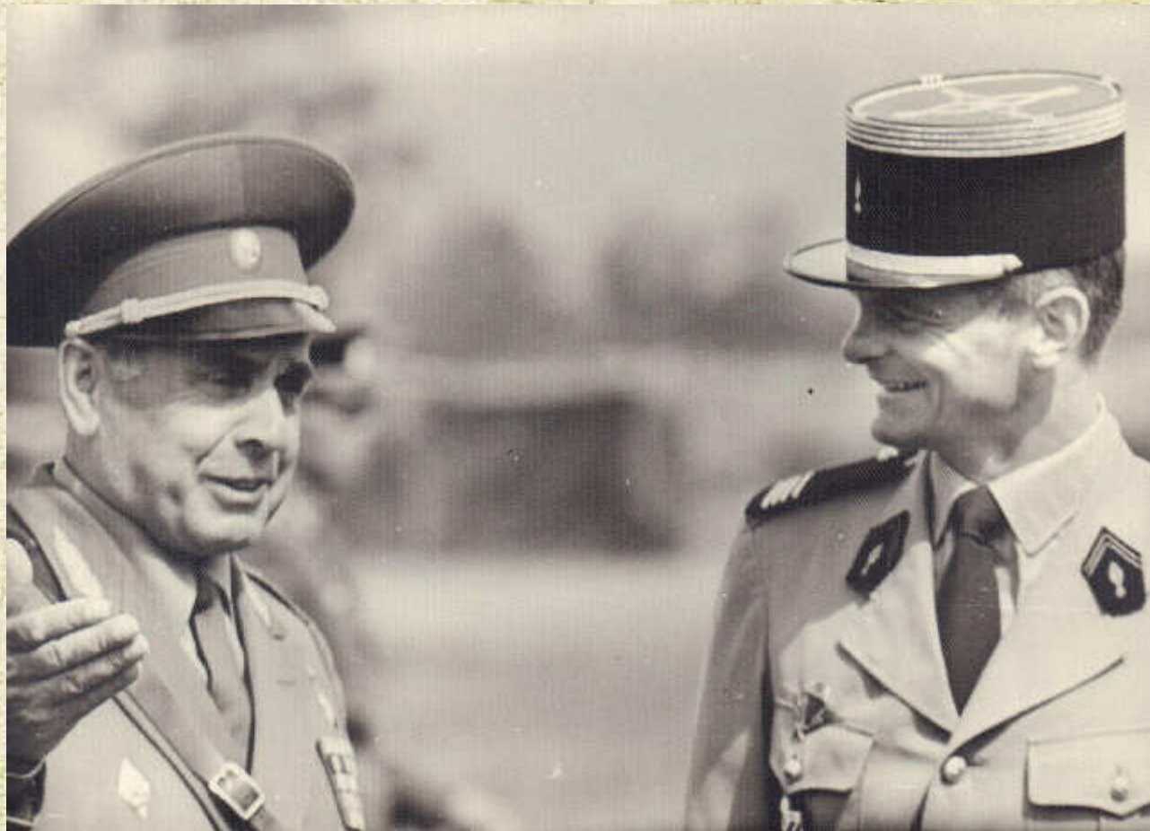
Встреча с французским офицером в период военных манёвров «Неман», 1981 год