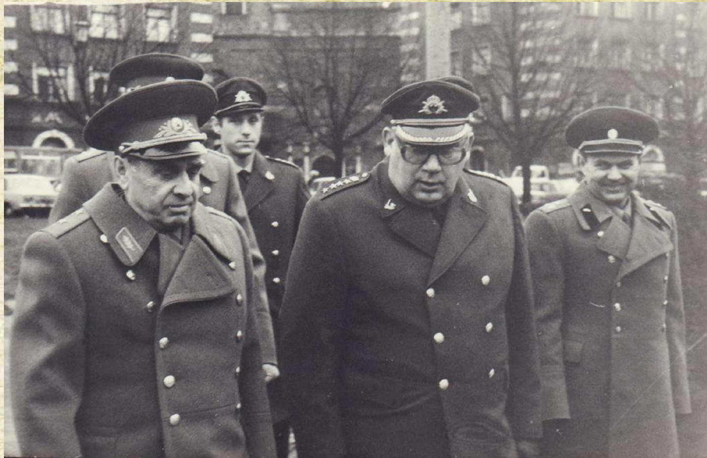
Беседа с руководителем наблюдателей от Швеции на учениях «Неман»